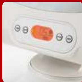
사용자를 고려한 초간단 조작법