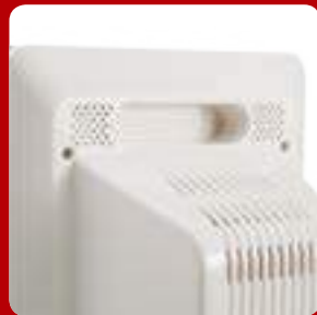
가벼운 무게와 이동형 손잡이