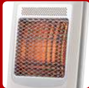
특허받은 ECO 반사판 기술

신일 에코히터는 고효율 ECO 반사판으로 열을 집중시켜 400W의 소비전력으로 1,000W 수준의 열효율을 통해 따뜻함을 실현합니다.