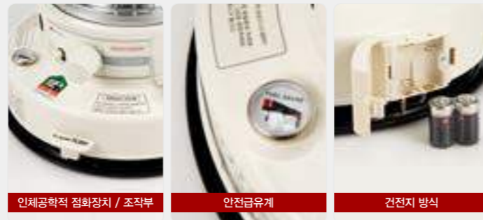
인체공학적 점화장치 / 조작부

4면으로 열기가 전달되어 난방의 사각지대 없이 실내 전체를 고르게 따뜻하게 만들어 줍니다.